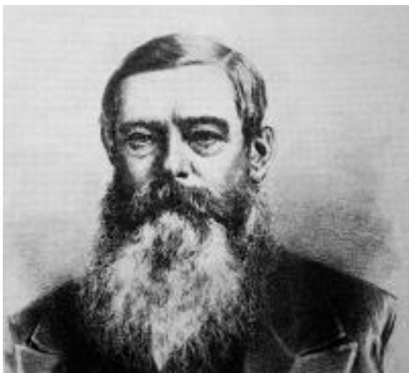
Johannes Henricus Brand

Brand is in 1863 gevra om president van die Oranje-Vrystaat te word na die dood van Marthinus Pretorius, en hy het amptelik op 2 Februarie 1864 in bewind getree om die vierde president van die OVS te word. Hy is daarna herkies en dien vier opeenvolgende termyne van 1869, 1874, 1879 en 1884. Bloemfontein was die middelpunt van die republiek, wat in 1854 onafhanklik geword het.