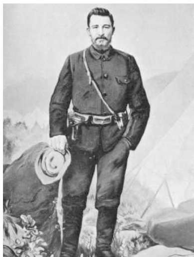
Christiaan de Wet

Christiaan Rudolf De Wet was 'n Boeregeneraal tydens die Tweede Vryheidsoorlog en 'n leier in die Rebelle van 1914. Teen die einde van die Tweede Vryheidsoorlog het hy die belange van die Oranje Vrystaat by die vredesamesprekinge verteenwoordig as waarnemende Staatspresident omdat pres. M.T Steyn te siek was om dit te doen. De Wet het met sy gesin teruggekeer na sy geruïneerde plaas, Rooipoort. In Julie van 1902 het hy sy vrou en kinders in 'n tent op die plaas agtergelaat en saam met genl. Louis Botha en genl. Koos de la Rey na Europa vertrek om geld te gaan insamel vir die weduwees en weeskinders wat deur die oorlog verarm is.