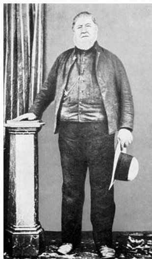
Jacobus Johannes (Koos) Venter

Hy was 'n lid van die Volksraad van die Oranje-Vrystaat, voorsitter van die Saamgestelde Kommissie vir die Bestuur van die Regering in 1855 en het gedien as Waarnemende Staatspresident in 1859 tot 1860 en weer van 1863 tot 1864. Met uitsondering van 'n kort onderbreking was Venter volksraadslid vir Bloemfontein-distrik en later vir Bethulie van 1854 tot 1881, bes moontlik die langste diens in die Vrystaatse Volksraad. Hy het hom veral onvermoeid vir die landbou beywer en Hollandse taalregte in die Vrystaat warm verdedig. Op 29 Augustus 1855 het hy 'n mosie van vertroue van die volksraad ontvang. Hy het ook waargeneem in die kritieke tussentydperk ná pres. Hoffman se afsetting.